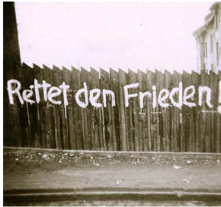
Wandparole in Saarbrücken. Etwa 1957

gesamten Umwelt, dass Kräfte erprobt würden, so lange deren Folgen nicht absehbar sind. Dass seine Voraussagen einmal Realität werden könnten, erleben