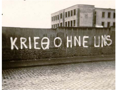
Wandparole in Saarbrücken. Etwa 1957

Heute, am 27. März 2011, also 57 Jahre nach Dr. Schweitzers erstem Appell (1954) an die Regierenden und die Völker der Welt, dem Wahnsinn des Wettrüstens und der atomaren Bedrohung allen menschlichen Lebens ein Ende zu setzen, stehen wir nach wie vor vor der selben Bedrohung. Es sind nicht nur die Atomwaffen, die noch einsatzbereit sind, sondern dazu kommen nun die AKWs zur friedlichen Energiegewinnung. Würde Dr. Albert Schweitzer, wenn er noch unter uns wäre, die gleiche Warnung wieder aussprechen, oder würde er sie gar verschärfen? Um meine Frage zu konkretisieren, lese ich einen Brief vor, der am 14. April 1954 im Londoner „Daily Harald“ veröffentlicht wurde: