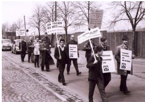
Ostermarsch in Saarbrücken. Etwa 1963

Im Vorwort zur 3. Auflage des Buches von Dr. Albert Schweitzers: „Friede oder Atomkrieg“ schreibt im Jahre 1984 Erhard Eppler, damaliger SPD-Politiker, der zwischen 1968 und 1974 Bundesminister für wirtschaftliche Zusammenarbeit war: „Was Albert Schweitzer vor zwei Jahrzehnten zu Atomrüstung, Atomtests und Atomkrieg zu sagen hatte, war eher trockene Information, nüchterne Aufklärung über Sachverhalte, allerdings so präzise, dass dem auch heute...“ - also mehr als fünfzig Jahre später „...wenig hinzufügen ist“; Ich füge hinzu: ...außer dass Dr. Albert Schweitzer