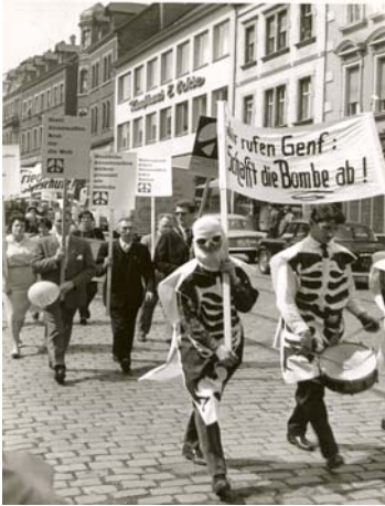
Die Forderungen nach Ächtung der Atombombe durch Albert Schweitzer wird von der Friedensbewegung aufgegriffen. Ostermarsch durch Sulzbach etwa 1962

uns Vermächtnis und Ansporn sein, in seinem Sinne ein Leben in Frieden für uns und unsere Nachwelt zu gestalten. Stattdessen haben Politiker in Berlin nichts Besseres zu tun, als sich mit gegenseitigen Schuldzuweisungen und Versäumnisvorwürfen öffentlich in Rundfunk und Fernsehen lächerlich zu machen. Ich muss nur an die Äußerungen des Wirtschaftsministers Brüderle vom vergangenen Donnerstag erinnern! Ich habe den Eindruck, dass es vielen Politikern aus den Regierungsfractionen zurzeit nur um Stimmenfang für die bevorstehenden Landtagswahlen geht. Mein persönliches Vertrauen in die Politik der Regierungskoalition ist auf das Tiefste erschüttert. Was schon immer gefehlt hat, ist