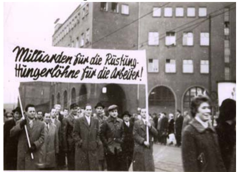
Kurz nach der Wiedervereinigung mit Westdeutschland wollten viele Saarländer nicht verstehen, warum Rüstung so teuer ist. Demo vor der Hauptpost in Saarbrücken 1959.

Bei solch lebenswichtigen Fragen muss auch das Volk in die Entscheidung mit einbezogen werden. Jetzt liegt es an uns, zu handeln. Wir können die Welt nicht verändern, aber wir können hier und jetzt, im Sinne der Ethik der Ehrfurcht vor dem Leben, agieren und reagieren. Das heißt für uns im Dreiländereck SaarLorLux: Wir, das Volk, müssen Flagge zeigen und dürfen die Entscheidung nicht der Politik alleine überlassen! „Nein“ muss das Gebot der Stunde lauten.