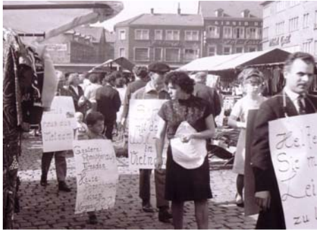
Friedensdemonstration über den Völklinger Markt. Etwa 1964